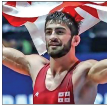
ვის დაუთმობს და გულშემატიკრებს კვლავაც გავგახარებს.