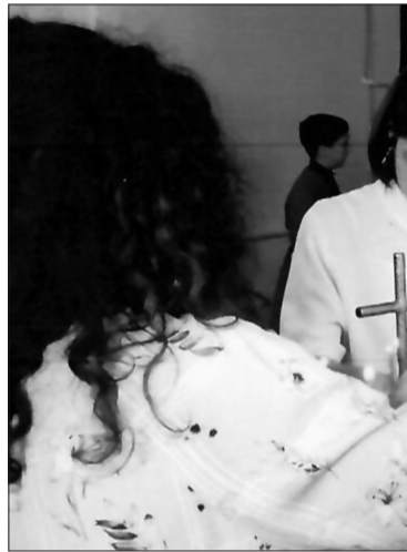
მე 9 აპრილის მომნიშვნელოვან დარბევებზე, გაიხსენეს თვითმზილეელთა ნაამბობი, იმსჯელეს ტრაგედიის შედეგებსა და მნიშვნელობაზე.