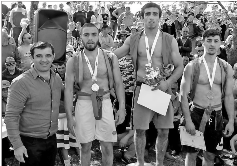
დასაწყისი 1-ელ გვ. -ზე