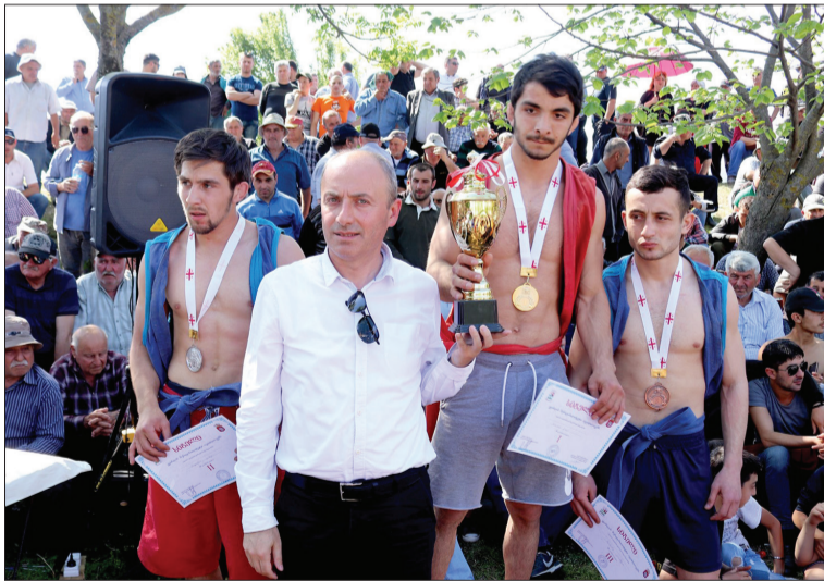
გაგრძელება მე-2 გვ. -ზე

ანაში არსებული არასახარბიელო მდგომარეობის გამო (უდენობა, ეკონომიური სიდუხჭირე, განუკითხაობა და კრიმინალი) ზოგიერთ სოფელში მცირე მასშტაბებში აღინიშნებდნენ, ზოგან კი საერთოდ მივიწყეს.