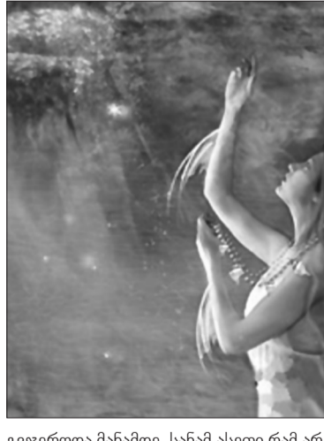
გვეჯეროდა მანამდე, სანამ ასეთი რამ არ მოხდა.