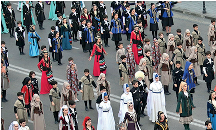
მასშტაბით პოპულარიზაციას კოსტიუმირებული დღესასწაულებით ცდილობს. თუ გავივლით აქტივობებს, საქართველოში რამდენად მრავალფეროვანი და

ყოველწლიურად, 18 მაისს, მუზეუმების საერთაშორისო დღე აღინიშნება. ამასთან ერთად, მესამე წელია საფორმული ჩაყარა და ტრადიციულ დამკვიდრდა ეროვნული სამოსის დღის აღნიშვნაც, რომელსაც კარნავალის სახე აქვს და კოსტუმირებულ მსვლელობას წარმოადგენს. მნიშვნელოვანია, რომ მსვლელობაში ქართველების გარდა, თავისი ეროვნული სამოსით, ნებისმიერი ეროვნების ადამიანი შეუძლია მონაწილეობის მიღება.