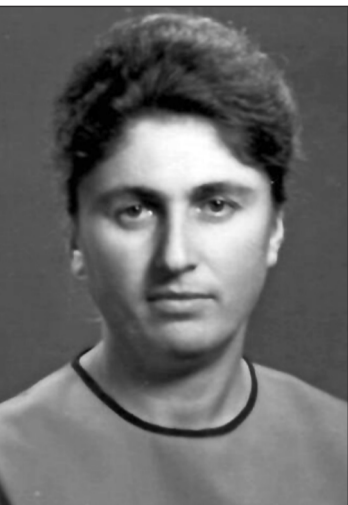
მოვიყვით თავს შენი შვილიშვილები, ახლობლები და ისეც ექნება სტუმრანი და ხალისიანი ოჯახი, როგორც წლების წინ იყო. ნათელი ედგეს შენს საშუალო სასუფეველს.

ჩვეურობა ქეთევანს, იძინე მშვიდად და გვეროდეს, შთამომავლობაში შენი სახელი არასოდეს არ დაიკარგება, ყოველთვის აგინებებ სანთლებს, უშენოდ აღვნიშნავთ შენს ყოველ დაბადების დღეს – 1 სექტემბერს. შენს ოჯახში ისეც