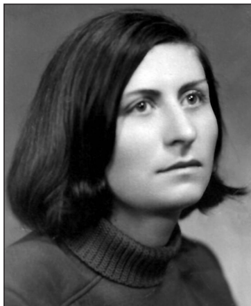
პირველად შეგხვდებით აღდგომას უშენოდ, მოგიყვით თავს, ყველა ერთად მოვალთ საფლავზე და გახარებთ ქრისტეს აღდგომას.

რვა ურთულესი თვე გავიდა ჩვენთან განშორებიდან, ტკივილიანი და ცრემლიანი. პანდემიამ გიმსხვერპლა. თვითონ კოვიდიანმა ავადმყოფ ოჯახის წევრებს მოუარე და უერთგულე თავდაუზოგავად. ამბობენ „დედა ქარში გატანილ ანთებულ სანთელს ჰგავსო“. რა სამწუხაროა, რომ ვერ გავფრთხილდი, სანთელს ხელეხე არ მოვეზრდი. რომ იცოდე რა ცარიელია ბინა, რომელსაც შენი ღიმილი ანათებდა და გულით ააბოზდი. აქ ყველაფერს შენი ხელი ამჩნევია და ყველა საგანი შენზე ყვება. რუდუნებით მოვლილ ნივთებს თუ მონიშნულ სტატკებს და ინტერვიუებს, საგანგებოდ დაკეცილ გაცრეცილ გაზეთებს მკითხველი მონატრათ შენი სახით.