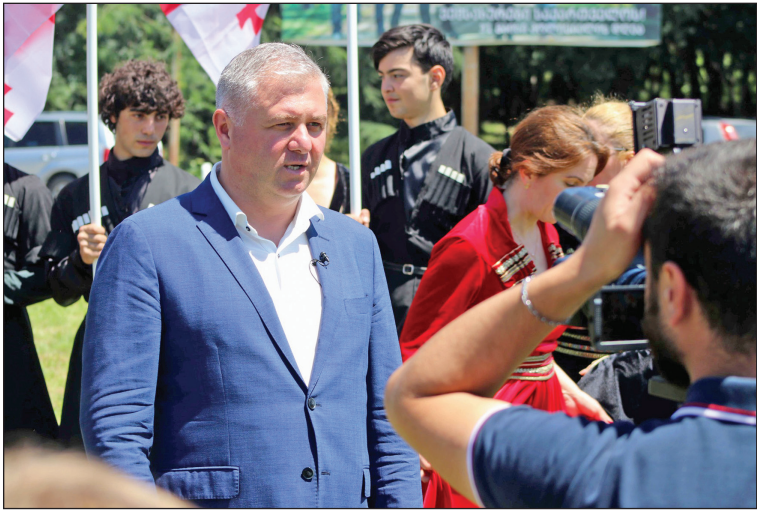
დასაწყისი 1-ელ გვ-ზე

ოქტომბრის თვეში, „ღვინის დღეებთან“ დაკავშირებით მომზადდა 6 სიუჟეტი, რომელიც სხვადასხვა ტელეკომპანიის ეთერში გავიდა.