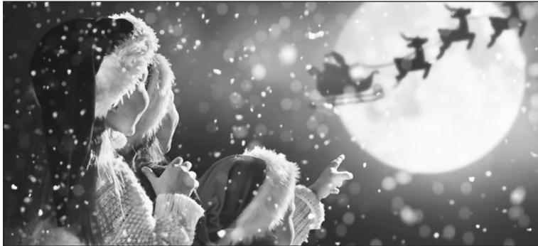
დასანყისი მე-ნ გვ.-ზე