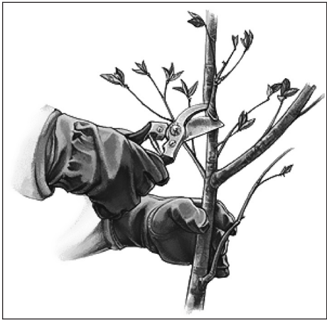
დასაწყისი 1-ულ გვ.-ზე

მოცილებას, რომელიც ტარდება მოსავლიანობის გაძლიერების, რეგულირებისა და ხარისხის გაუმჯობესების მიზნით. გასხვლა სპეციფიკური აგროლონისიძებაა, რომელიც მოითხოვს გარკვეულ ცოდნას და გამოცდილებას და რომელზეც მთლიანად არის დამოკიდებული მოსავლის რაოდენობა და ხარისხი. გასხვლის პროცესში მსხველმძებ უნდა გაითვალისწინოს ვაზის ჯიშის ბიოლოგიური თვისებები, ნიადაგის ნაყოფიერება, ვაზის ბუჩქის მდგომარეობა და შესაბამისად შეარჩოს გასხვლის მეთოდი.