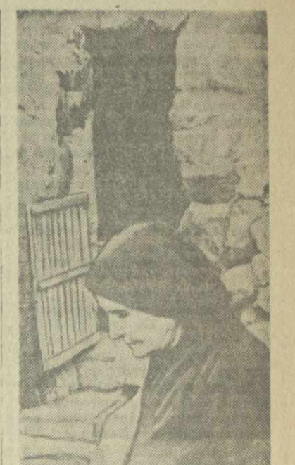
Италия. Остров Сицилия. Деревня Шинди. Здесь люди ютятся в пещерах, приспособленных для жилья. На снимке: женщина в одной из таких пещер.

В связи с усиленным пронижением в Иран иностранного и в первую очередь американского капитала экономическая страна переживает тяжелый кризис и во все возрастающей степени подпадает под иностранный контроль.