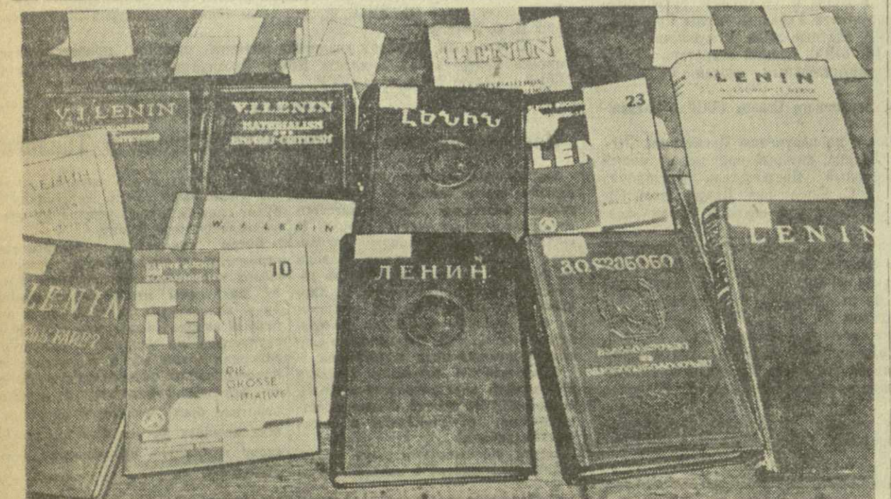
Книга В. И. Ленина «Материализм и эмпириокритицизм» издавалась в СССР более 80 раз, общим тиражом в 4442 тысячи экземпляров, на многих языках народов СССР: русском, украинском, белорусском, узбекском, казахском, грузинском, азербайджанском, латышском, тагарском и других. В странах народной демократии — Китае, Польше, Румынии, Венгрии, Чехословакии, Болгарии, Корейской Народно-Демократической Республике, ГДР, Албании произведение В. И. Ленина «Материализм и эмпириокритицизм» выдержало несколько изданий. Много раз издавался Ленинский труд в капиталистических странах — США, Италия, Франция, Англия, Индия, Австрия, Греция, Бельгия, Голландия, Дания, Норвегия, Швеция, Израиль, Япония. На снимке: Собрание Сочинений и отдельные труды В. И. Ленина, изданные на языках народов СССР и в зарубежных странах.