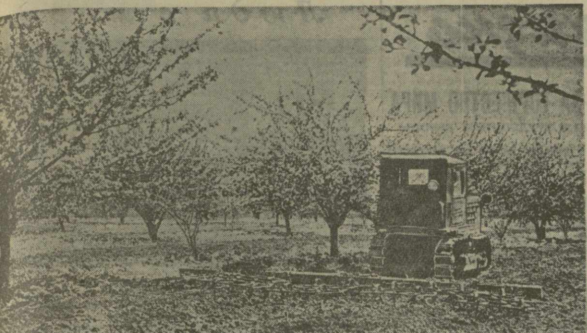
Колхоз имени Кецхели села Тквари Горьского района. На снимке: обработка междурядий в фруктовых садах.