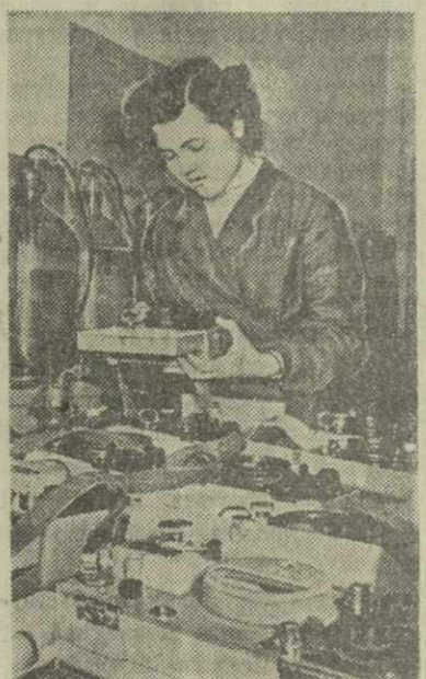
Харьковским филиалом Всесоюзного опытно-конструкторского бюро автоматизации за последние годы разработаны и в его экспериментальных мастерских выпускаются 88 наименований приборов и средств автоматизации для химической промышленности.