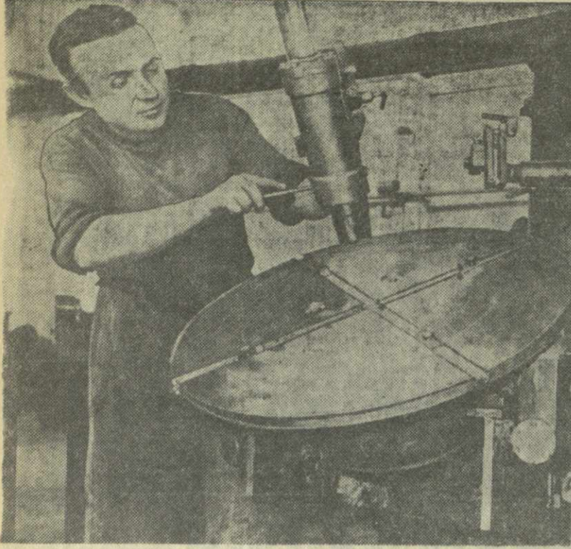
Коллектив Тбилисского завода электросварочного оборудования освоил производство нового агрегата АДК-500-6 для сварки кольцевых швов под флюсом. Конструкция этого агрегата разработана Всесоюзным научно-исследовательским институтом электросварочного оборудования.