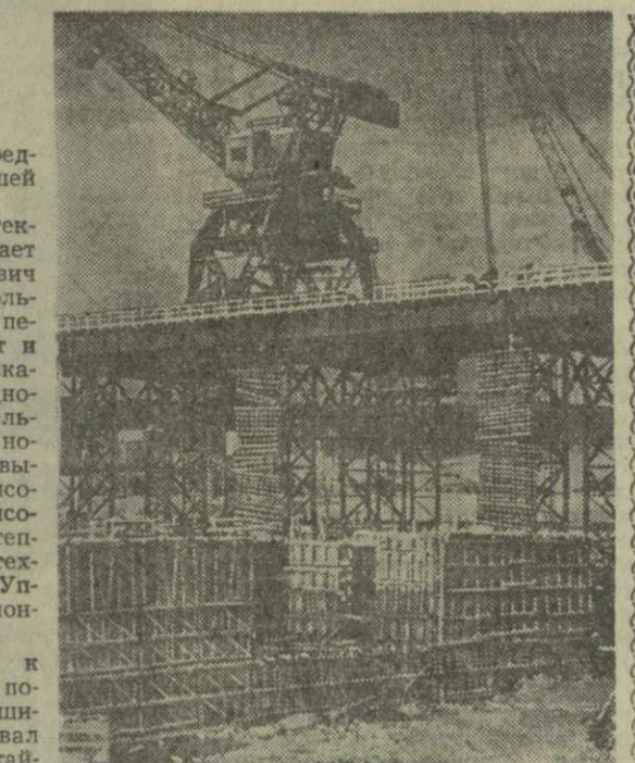
На снимке: в правобережном котловане поднимается «бычки» водосливной плотины.

(Продолжение. Начало см. «З. В.» — 23 мая с. г.).