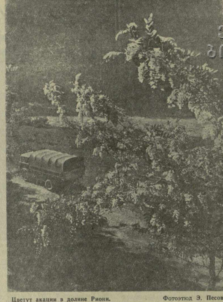
Цветут акации в долине Риони.