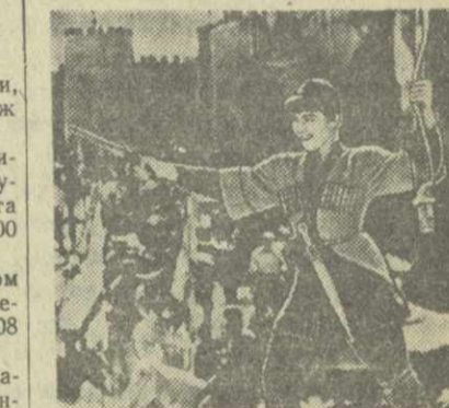
Кадры из кинофильма «Майя Цхнетиел»

На экранах Тбилиси демонстрируется новая художественная кинокартина студии «Грузия-фильм» «Майя Цхнетиел», посвященная историческому прошлому грузинского народа.