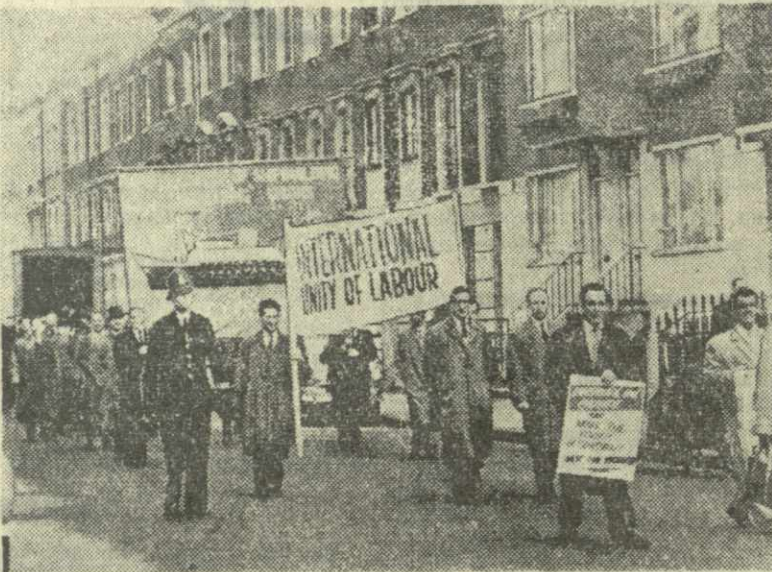
На снимке: Англия. В Лондоне состоялась демонстрация представителей рабочих северо-западных графств Ланкашир и Чешир, потребовавших гарантировать им право на труд.

БЕРЛИН, 9 июня. (ТАСС). Население Берлинской Демократической Республики расценивает визит партийно-правительственной делегации ГДР в Советский Союз как новый убедительный шаг к укреплению дружеских отношений между Советским Союзом и ГДР.