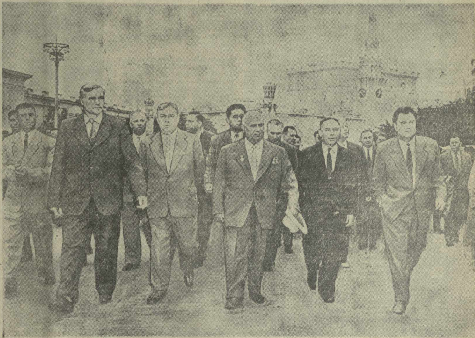
Выступая на митинге посвященном открытию ВДНХ, на котором собрались представители трудящихся Москвы и Московской области, посланцы республик и областей СССР, передовики промышленности и сельского хозяйства, товарищ Н. С. Хрущев сказал, что выставка должна стать хорошей школой изучения и распространения новейших достижений в народном хозяйстве, она должна отражать уровень и пути технического прогресса на конкретных примерах, показывать передовые методы труда и организации производства, культуру земледелия и животноводства.

На снимках: 1. Руководители Коммунистической партии и Советского правительства осматривают выставку. 2. На Выставке достижений народного хозяйства СССР.