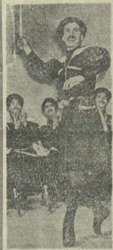
На снимке: фрагмент из нового танца «Ханджлури», специально подготовленного ансамблем для выступления в Нью-Йорке.

Из Москвы грузинский ансамбль в составе других коллективов из братских республик вылетит в Соединенные Штаты Америки, куда он приглашен на открытие выставки «Достижений СССР в области науки, техники и культуры» в Нью-Йорке.