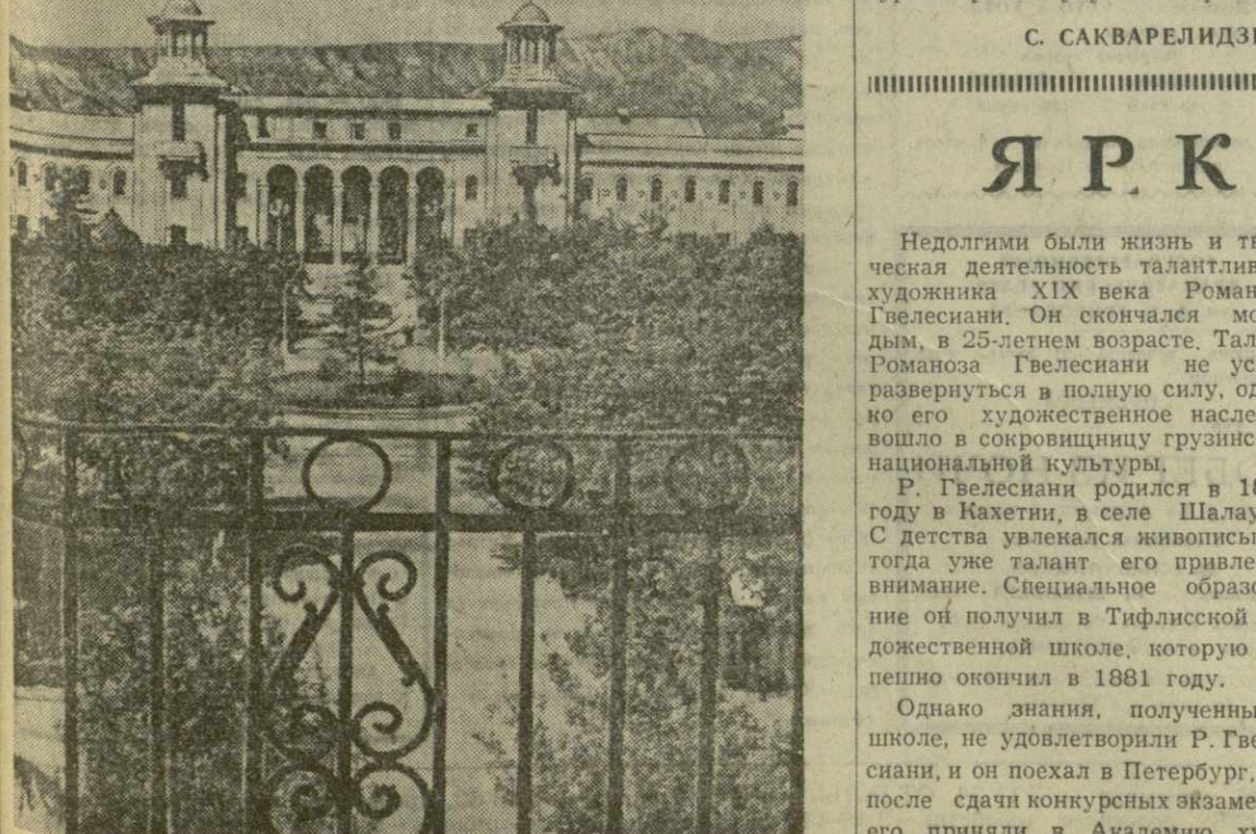
Рустави. Вид на Дворец культуры металлургов.

Убедившись в очевидном несовершенстве продукции бытового назначения, выпускаемой тбилискими предприятиями, в том, что она очень проигрывает по сравнению с московской, ленинградской и другой, мы отправились в Управление местной промышленности исполкома Тбилисгорсовета, возглавляемое которым П. Гваздазе.