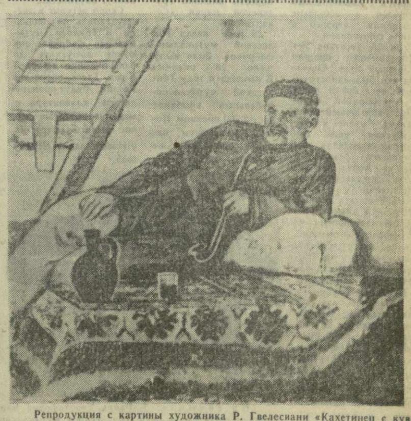
Репродукция с картины художника Р. Гвелесани «Кахетинец с кувшином».

В 1958 году преступность достигла небывалого высокого уровня, показав страшный прирост по сравнению с 1957 годом.