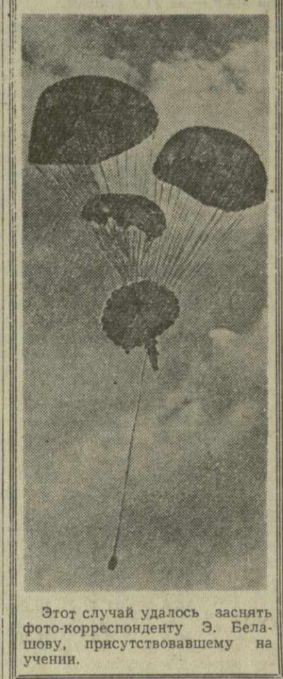
Этот случай удалось заснять фото-корреспонденту Э. Белашову, присутствовавшему на учении.