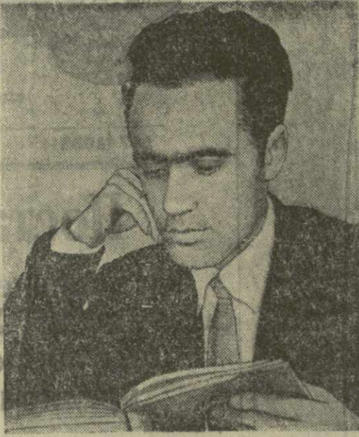
На снимке: поэт Ф. Халваши.