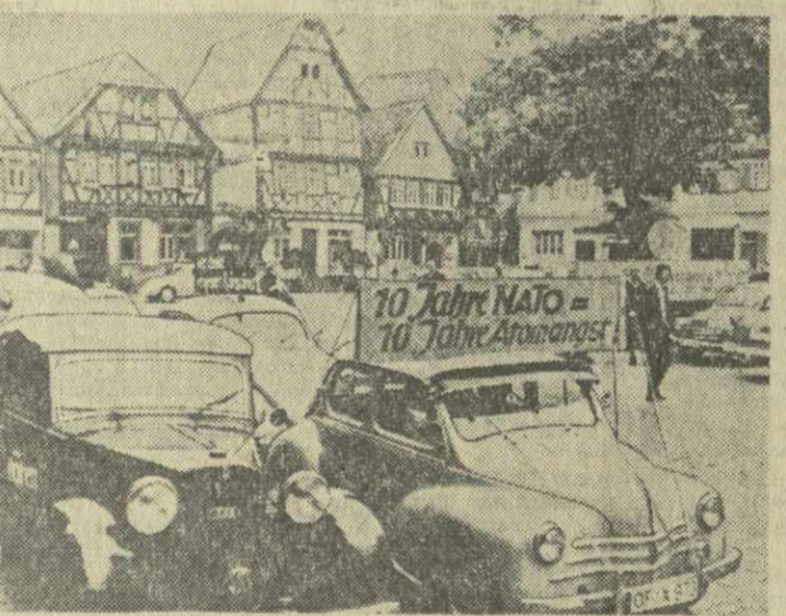
Федеративная Республика Германия. Автомобильное шествие в Земгенштаде (земля Гессен) против атомного вооружения.

рижском пригороде Аржантей. В этом году, пишет Дюкло, праздник «Юманите» пройдет под лозунгом протеста против политики монополий и их правительства, борьбы за восстановление и обновление демократии, выражения доверия французских трудящихся своей партии и своей газете.