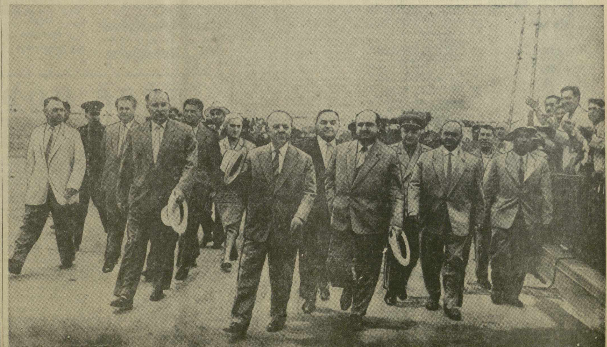
На снимке: проводы К. Е. Ворошилова на Тбилисском аэродроме.

29 июля 1959 г., в 10 ч. утра, в Доме железнодорожника (пр. Плеханова, 127-а), созывается пленум Грузинского республиканского совета профсоюзов. Президиум Совпрофа Грузии.