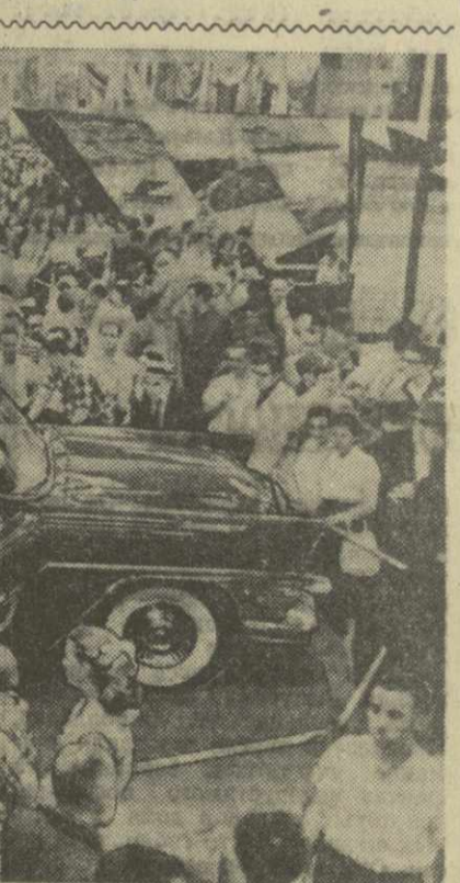
На советской выставке в Нью-Йорке. Посетители выставки осматривают автомашину «Чайка» Горьковского автозавода.