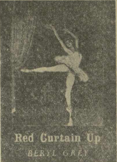
Red Curtain Up BERIL GREY

В декабре 1957 года в Грузию гостила известная английская балерина Берил Грей, совершавшая гастрольную поездку по Советскому Союзу. В Тбилиси английская балерина присутствовала на балете А. Мачавариани «Отелло».