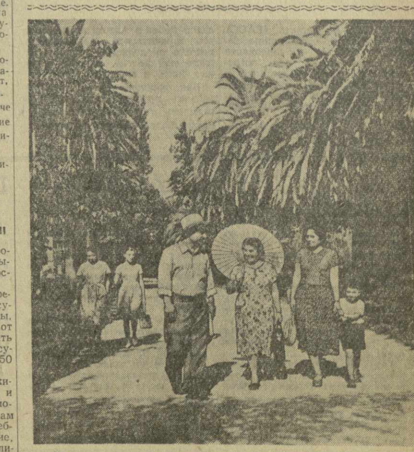
Живописная природа замечательного курорта Черноморского побережья — Гагра привлекает сюда людей со всех концов страны. Здесь свой отпуск проводит московский рабочий и угольник из Донбасса, ученый Ленинграда и целник из Казахстана, лесоруб Севера и электрик Грузии и другие. Благоустроенные санатории, прекрасные пляжи, тенистые парки курорта создают все условия для полноценного отдыха. На снимке: в пальмовой аллее Гагрского парка.

ТЕЛАВИ. (Корр. «Зари Востока»). В 1958—1957 учебном году при шестнадцатой средней школе был организован специализированный класс, один из тех, что были созданы в 20 школах Грузии. В шестнадцатой школе вместе с изучением общеобразовательных предметов учащиеся овладевали основами виноградарства и виноделия, готовились к практической работе на производстве. Производственное обучение они проходили на винном заводе Циналдского совхоза. Раз в неделю специалисты завода проводили с учащимися теоретические и прак-