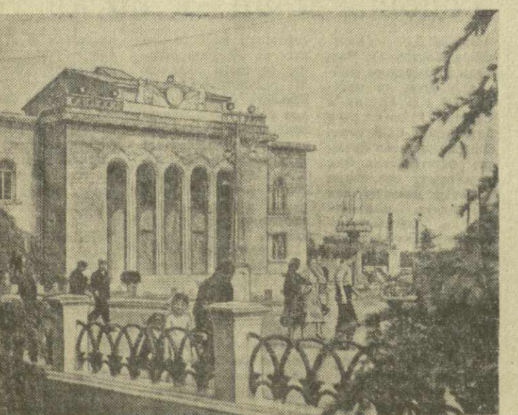
Самтредиа. Здесь на Привокзальной площади заканчивается строительство районного Дома культуры. На снимке: новый Дом культуры в Самтредиа.

Разработаны мероприятия по быстрейшей ликвидации недостатков, отмеченных в корреспонденции.