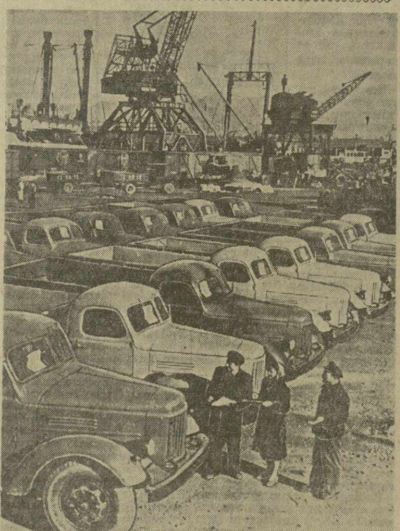
Во все концы страны отсылает свою продукцию Кутанский автомобильный завод имени Орджоникидзе. Часть продукции идет через Батумский порт, откуда суда доставляют автосамосвалы на Украину, в Молдавию и т. д. На снимке: очередная партия кутанских автомобилей перед отгрузкой в Батумском порту.

На Херсонском консервном заводе имени Сталина горьким консервщикам очень понравилась машина