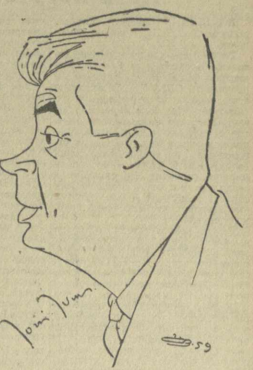
Иорис Ивенс. Дружеский шарж Г. Пирцхалава.

Ответ: К сожалению, в этом году я лишен этой возможности. Но надеюсь, что в недалеком будущем я смогу приехать в Грузию и возобновить старые знакомства, а также завести новые. Вопрос: Каковы ваши творческие планы? Ответ: Сейчас я буду снимать телевизионный фильм в Италии и картину на юге Франции, в Провансе. Картина эта называется «Мистраль». А затем поеду в Италию. Г. БАДРИДЗЕ. (Корр. «Зари Востока».) Москва.