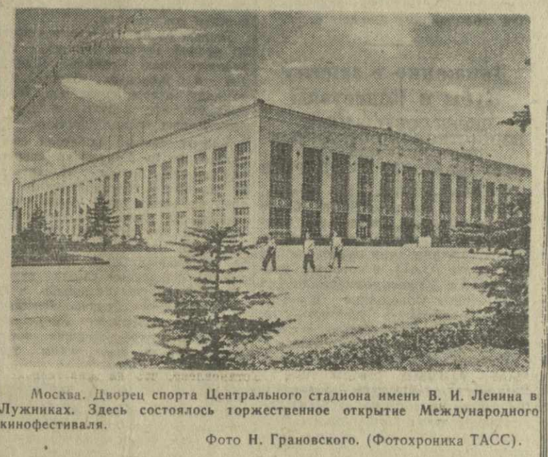
Москва. Дворец спорта Центрального стадиона имени В. И. Ленина в Лужниках. Здесь состоялось торжественное открытие Международного кинофестиваля.