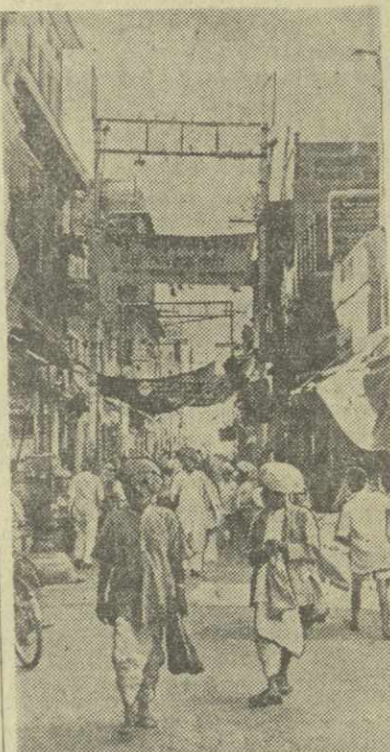
Индия. Улица в городе Джодхпуре.