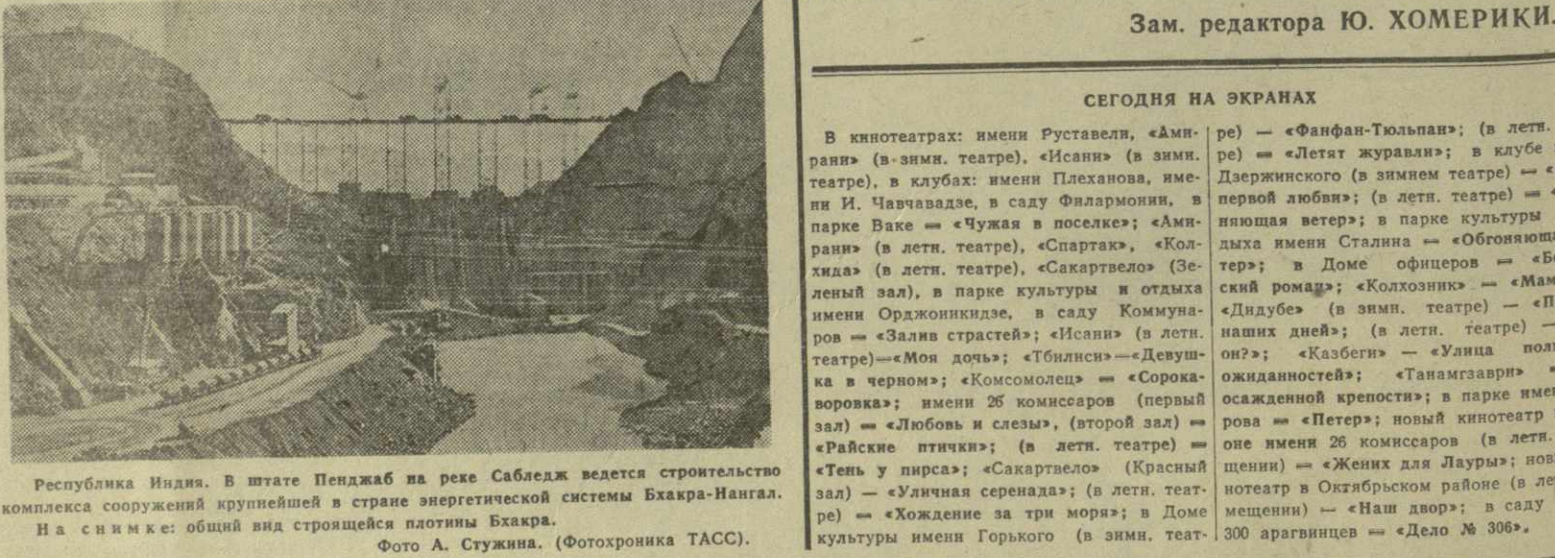
Республика Индия. В штате Пенджаб на реке Саблеж ведется строительство комплекса сооружений крупнейшей в стране энергетической системы Бхакра-Нангал. На снимке: общий вид строящейся плотины Бхакра.

Т. ОНОПРИШВИЛИ, старший референт Грузинского общества дружбы и культурной связи с зарубежными странами.