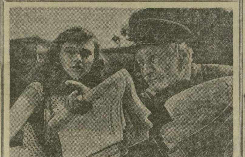
На киностудии «Грузия-фильм»

КВИРИЛЬСКОЕ РЕПОРТАЖ. Которыми наши рабочие овладевают все лучше. Успеху способствует и то, что с помощью Чистурского горкома партии с разных рудников к нам переведено на работу более 70 квалифицированных рабочих, большинство которых — коммунисты. На руднике «Итхьяси-Новый» мы подняли недавно стали применять погрузочные машины новых марок, которые производят успешно. Применение этих машин позволит почти удвоить механизированную погрузку руды.