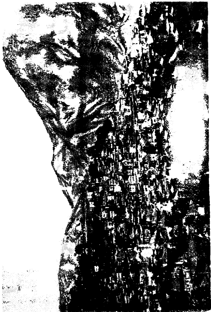
3. აკადემი, 1897 წ.