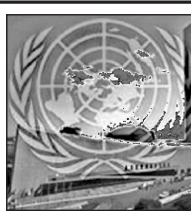
რიგგარეშე მოხდება, მაგრამ საქართველოს უშიშროების საბჭოს წევრად არის, რომ რუსეთი გაეროს უშიშროების საბჭოს წევრად არის...