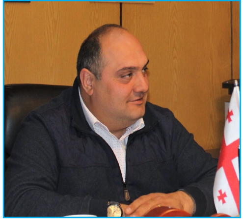
ქრისტე აღდგა! - ჭეშმარიტად აღდგა! გილოცავთ აღდგომის ბრწყინვალე დღესასწაულს!

მართლმადიდებლებისთვის აღდგომა უმთავრესი რელიგიური დღესასწაულია, რომელიც ყველას განსაკუთრებულ სიხარულს გვანიჭებს, რადგან მაცხოვრის მკვდრეთით აღდგომა კაცობრიობა დაკარგულ ედემში დააბრუნა და განუმტკიცა რწმენა, რომ სამყაროში სიცოცხლე და