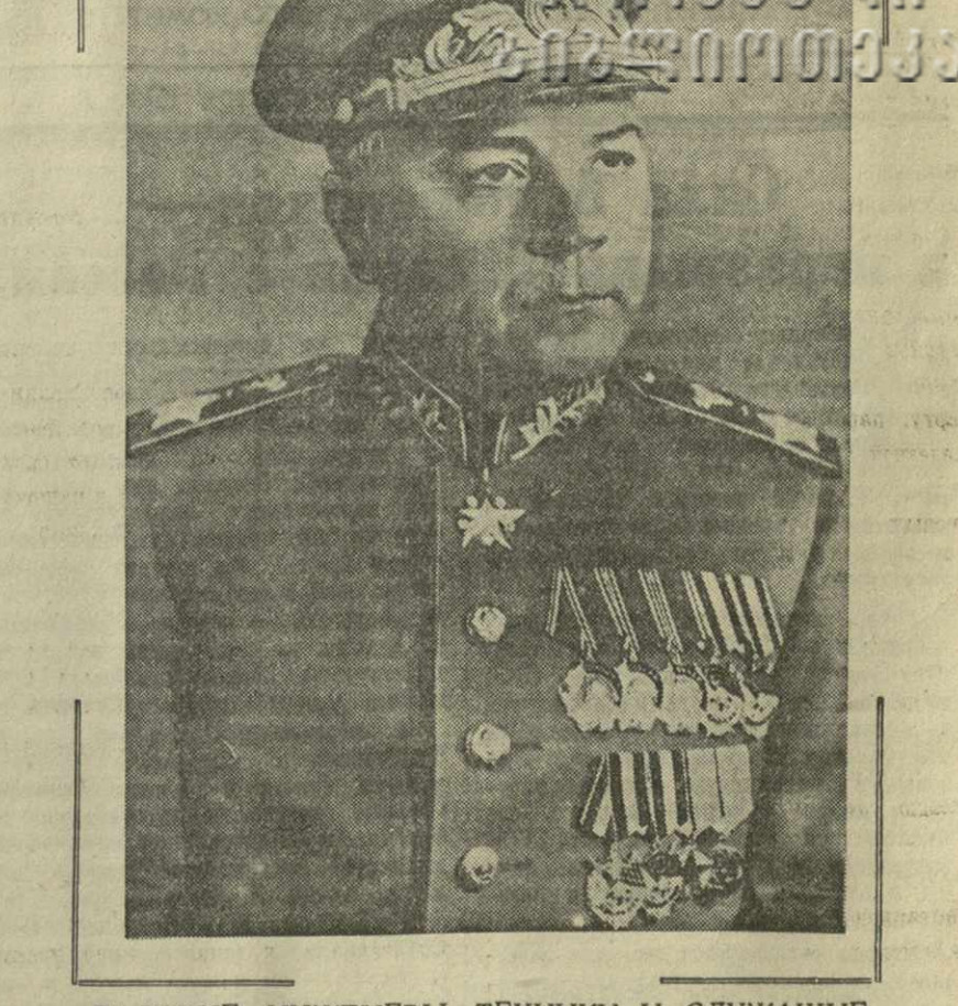
РАБОЧИЕ, ИНЖЕНЕРЫ, ТЕХНИКИ И СЛУЖАЩИЕ ТБИЛИССКОЙ КАРТОГРАФИЧЕСКОЙ ФАБРИКИ № 8 ВЫДВИНУЛИ КАНДИДАТОМ В ДЕПУТАТЫ СОВЕТА СОЮЗА МАРШАЛА СОВЕТСКОГО СОЮЗА ТОВАРИЩА

Общее собрание рабочих, служащих, инженерно-технических работников и техников товарища Шверника Николая Михайловича дать свое согласие баллотироваться в депутаты Совета Союза Верховного Совета СССР по Ленинскому избирательному округу гор. Москвы.