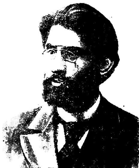
შოთა რუსთაველი (1873—1906)