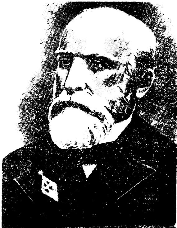
ალექსი კიპინაძე (1851—1917)