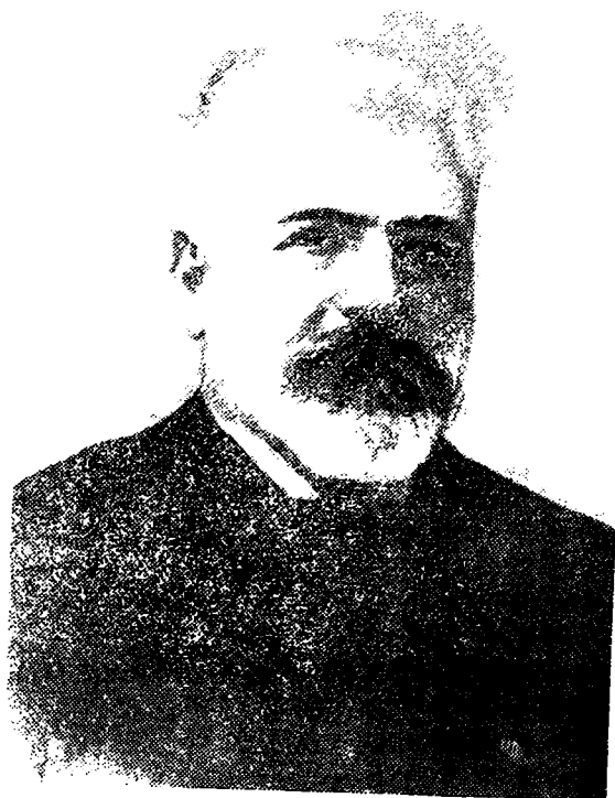
ნიკოლ ცხვედაძე (1845—1911)