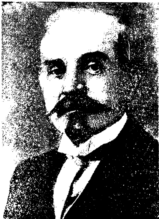
ივანე გამყელაური (1867—1951)