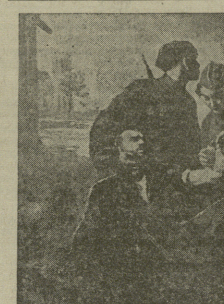
А. Зурабов. «Первая помощь».