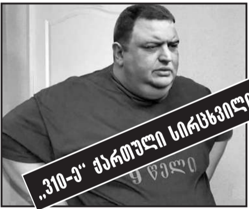
„310-ე“ ქართული სირსხვილი