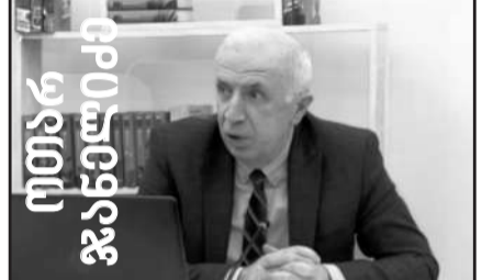
საქართველოს განსვლავული ისტორიის შემოქმედი