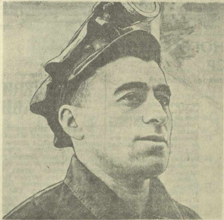
А. Бакурадзе.

Вместе со всем коллективом шахты Бакурадзе рос, совершенствовал свое мастерство. Он радовался каждому