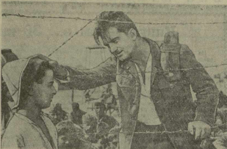
Кадр из фильма «Любовь побеждает», съемки которого ведет студия «Грузия-фильм» совместно с Братиславской студией (Чехословакия).