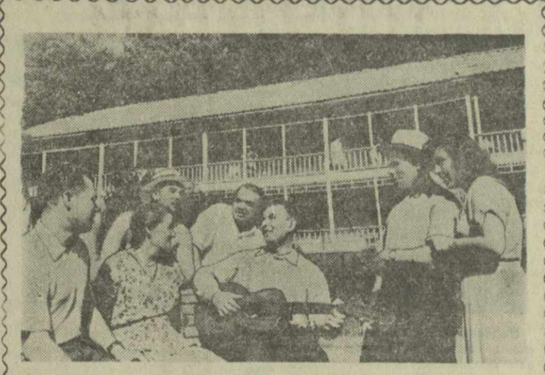
В г. Ткварчели, в живописной местности, расположен горный санаторий «Галагза». Ежегодно здесь отдыхают шахтеры различных угольных бассейнов нашей страны.

ПАРИЖ, 28 августа. (ТАСС). В Алжире не утихают ожесточенные бои между французскими войсками и отрядами Алжирской национально-освободительной армии. По сообщениям печати, алжирские войска в ночь на 27 августа предприняли крупную операцию в районе алжиро-тунисской границы.