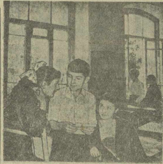
ШКОЛА была готова еще месяц назад. Об этом позаботились учащиеся, оставшиеся на лето в городе. Старшеклассники 77-й тбилисской средней школы своими руками починили все парты, стулья, столы, доски, шкафы. А как похорошела и разрослась столовая мастерская! Работа здесь кипела все лето — доказательство этому новенькие деревянные ящики, изготовленные по заказу Жиркомбината. На почетном месте стоит недавно сделанное приобретение — механический рубанок.

ЛОНДОН, 29 августа. (ТАСС). Министр иностранных дел Испании Фернандо Кастилья прибыл сегодня в Лондон, чтобы встретиться с президентом США Эйзенхауэром и вести переговоры с государственным секретарем США Гертером и министром иностранных дел Англии Селвином Ллойдом. По прибытии в Лондон Кастилья заявил, что он приехал для того, чтобы попытаться добиться приема Испании в НАТО. Тем не менее он добавил: «Наше соглашение с Португалией и Соединенными Штатами и мощная сеть военно-воздушных и военно-морских баз, которая сейчас завершена, превращает нас в важное звено в любом плане европейской обороны. Фактически мы приехали сюда для того, чтобы обсудить с Соединенными Штатами проблемы, представляющие общий интерес».