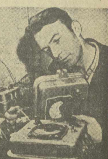
Электронный прибор дистанционного управления создали конструкторы завода «Физприбор» в Москве. Он предназначен для управления на расстоянии различными технологическими процессами в химической и пищевой промышленности. Завод начал серийный выпуск приборов.

Шло время, накапливался опыт, рос авторитет молодых врачей. И вот настал момент, когда все эти перемены вдруг проявились с необычайной яркостью, когда креп-