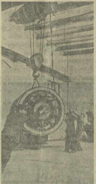
В колесно-токарном цехе Сухумского электровозного депо тельфер грузоподъемностью в пять тонн бездействует. Изделия приходится переносить вот таким образом.