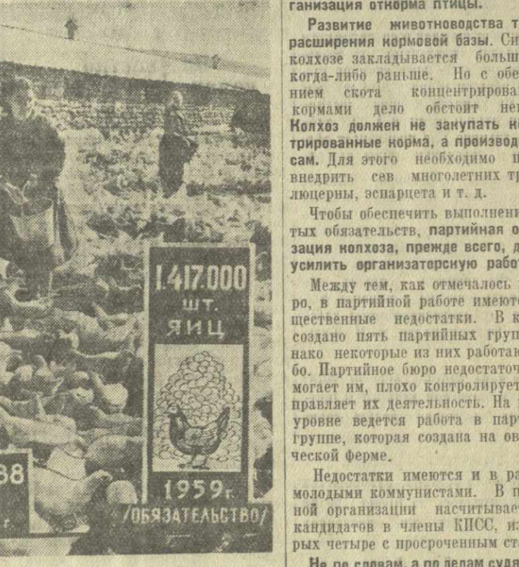
Рост производства яиц в колхозе «Сакартвело».