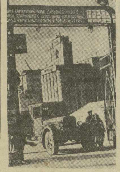
Кустанайская область. В крупнейшей целинной области Казахстана началась массовая сдача государству хлеба нового урожая. На многочисленных элеваторах и хлебобрикетных пунктах ежедневно поступает более миллиона пудов зерна. На снимке: одно из крупнейших зернообрабатывающих предприятий республики — Кустанайская перерабаточная база. Основные производственные процессы по обработке зерна здесь механизированы и автоматизированы.

Государственное издательство политической литературы выпустило в свет отдельную брошюру статью Н. С. Хрущева «О мирном сосуществовании», написанную по просьбе редакции американского журнала «Форин Аффэрс» и опубликованную в этом журнале. Брошюра издана массовым тиражом. (ТАСС).