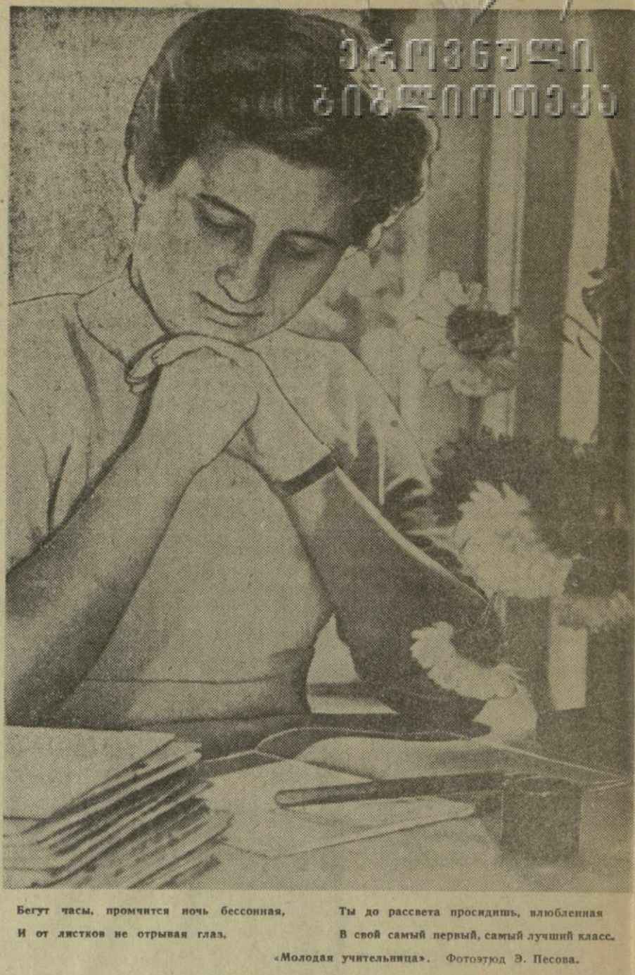
Бегут часы, промчится ночь бессонная, Ты до рассвета просидишь, влюбленная И от листков не отрываешь глаз. В свой самый первый, самый лучший класс. «Молодая учительница».