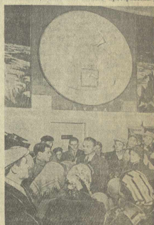
Москвичи проявляют большой интерес к сообщению о запуске третьей советской космической ракеты. А в снимке: посетители Московского планетария слушают сообщение лектора о запуске третьей советской космической ракеты.