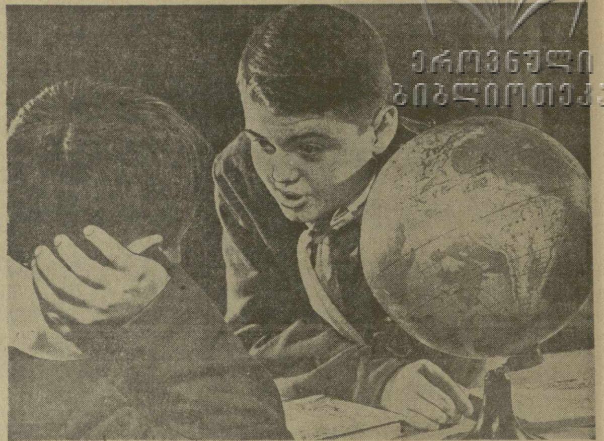
Как думаешь, скоро будем изучать лунную географию?

Все полуфабрикаты и кулинарные изделия будут поступать в продажу в целлофановой упа-