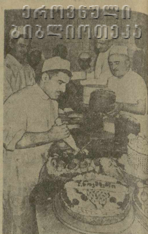
Пекарня № 2 треста Грузахлебкондитера одна из лучших в городе. Квалифицированные мастера-пекари здесь выпускают разнообразные кондитерские изделия высшего качества. К праздничным дням пекарня значительно увеличивает выпуск продукции.

Богатый выбор продуктов на колхозных рынках города. 257 колхозов из 22 районов республики ежедневно доставляют на рынок свежее мясо, овощи, фрукты, молочные продукты. К праздничным дням количество завозимых продуктов значительно увеличивается.