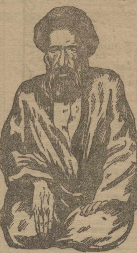
СЕЙД ГАССАН МУДЕРРИС