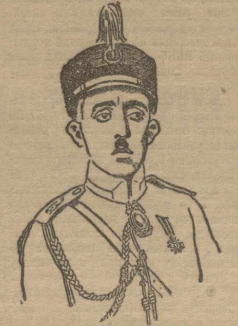
АБДУЛЛА-ХАН, Губ. губернатор Тейрана