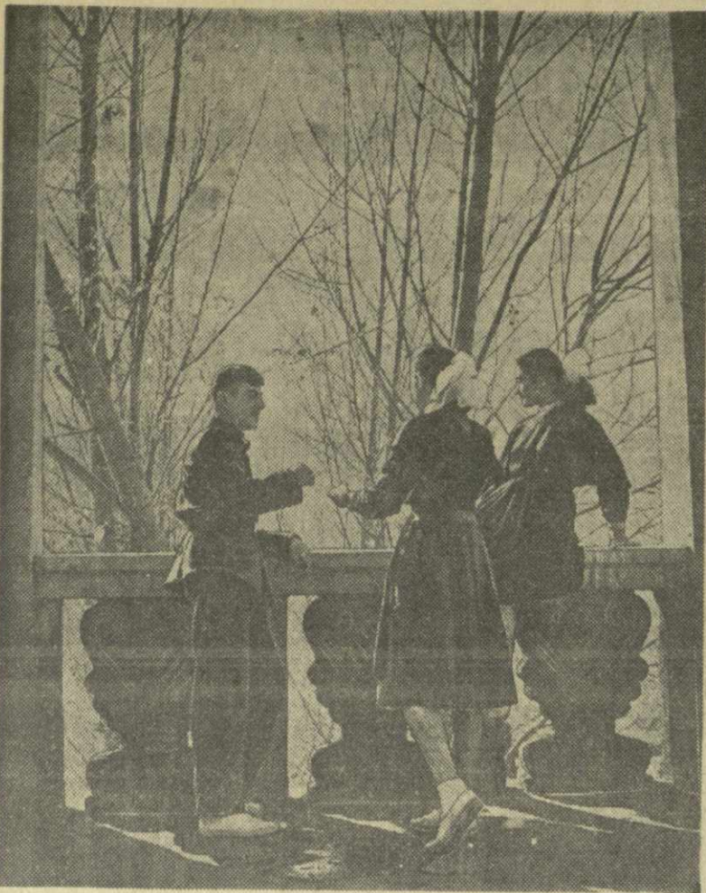
Осенний день.