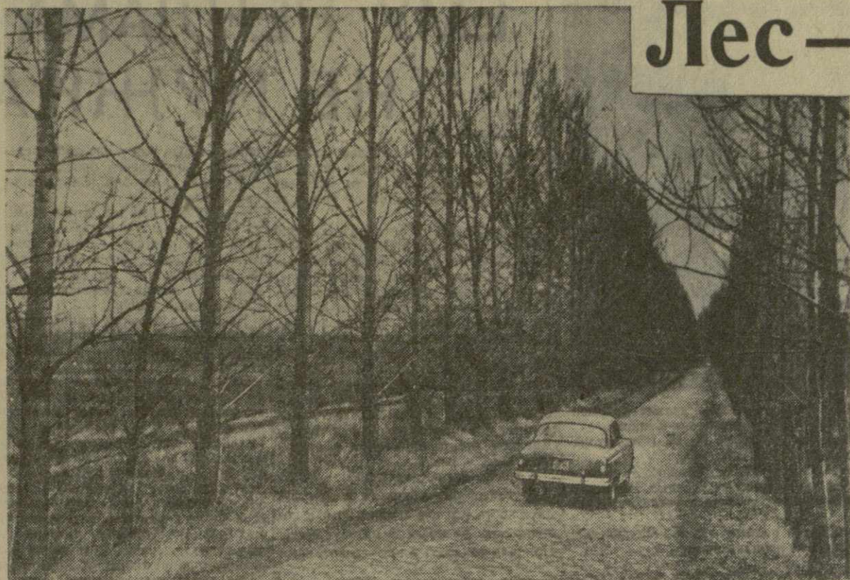
На снимке: поделзацинные лесные полосы в Тбилиском базисном питомнике.

Охрана лесов в условиях нашей республики имеет огромное значение как в получении высоких и устойчивых урожаев, так и для предотвращения эрозийных процессов, регулирования водного режима, противодействия вредным, засухливым и холодным ветрам.