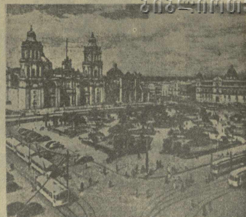
В столице Мексики городе Мехико открылась Выставка достижений Советского Союза в области науки, техники и культуры...