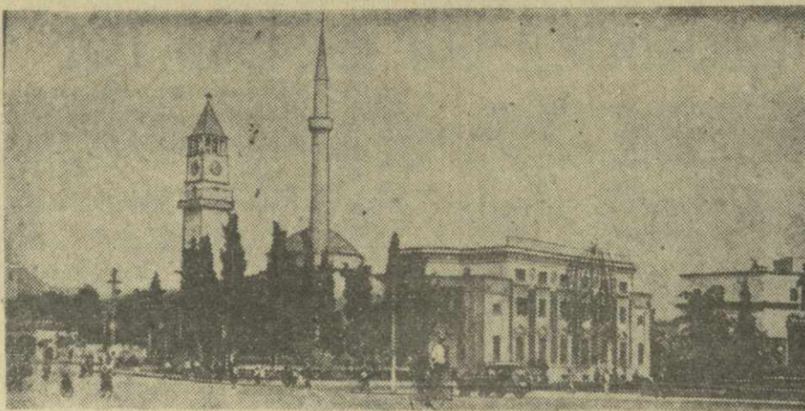
Народная Республика Албания. Площадь Скандербег в Тиране.

29 ноября 1944 года в благоприятных условиях, созданных великими победами Советской Армии, албанский народ одержал самую большую победу в своей истории. Он навсегда изгнал фашистских захватчиков с многострадной албанской земли.