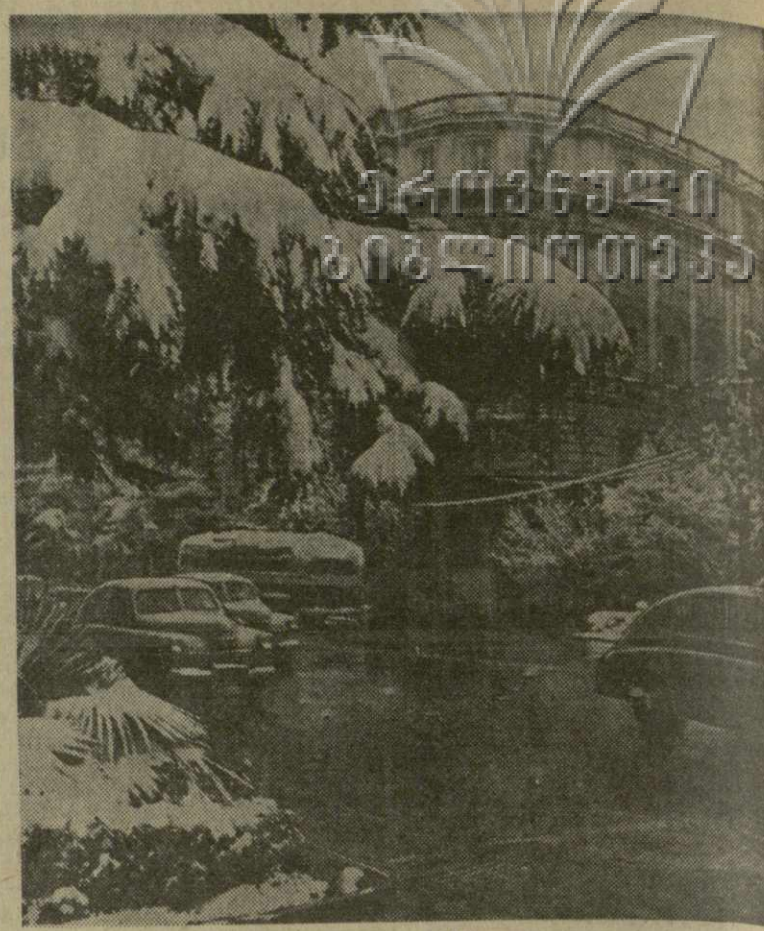
Первый снег в Тбилиси.