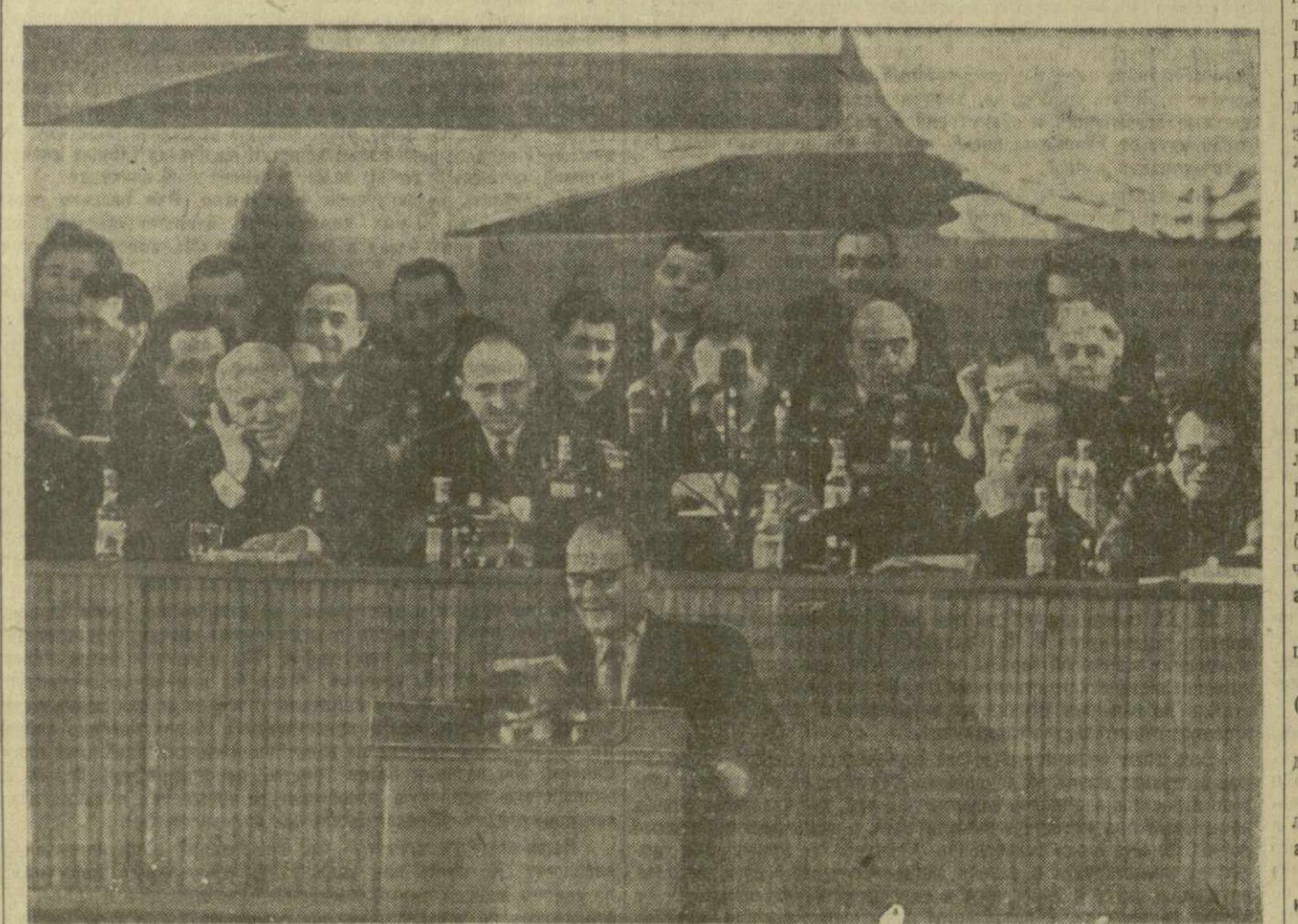
Президиум VII съезда Венгерской социалистической рабочей партии. С отчетным докладом выступает Первый секретарь ЦК ВСРП Янош Кадар.

Да здравствует марксизм-ленинизм! (Бурные, продолжительные аплодисменты).