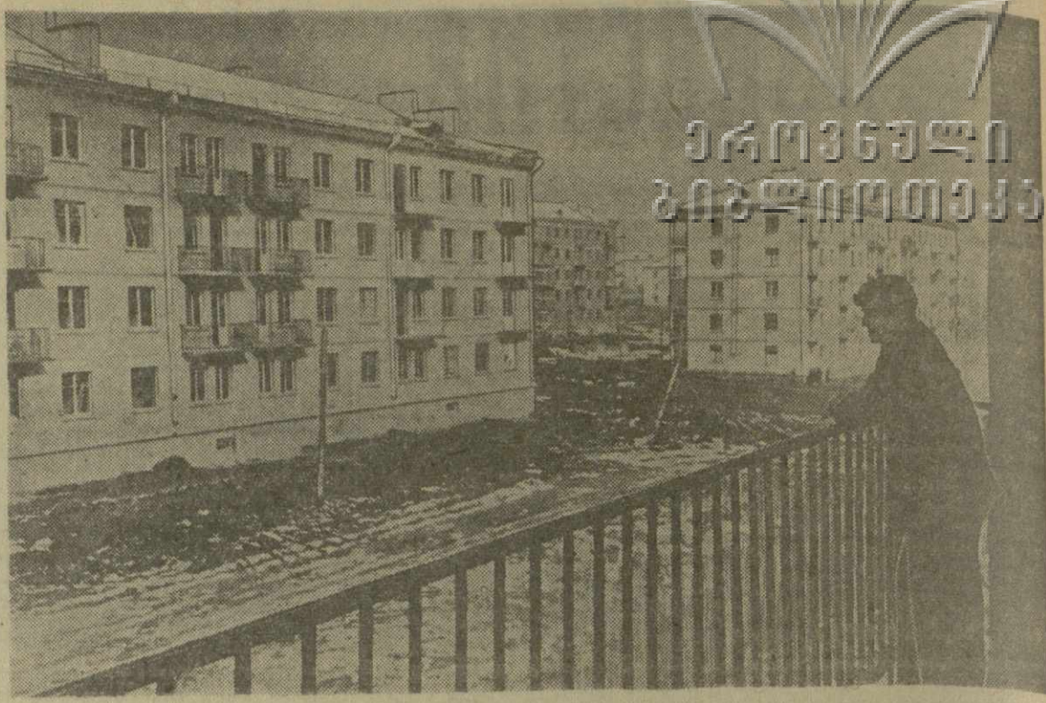
На снимке: новые жилые дома в районе Сабуртало.