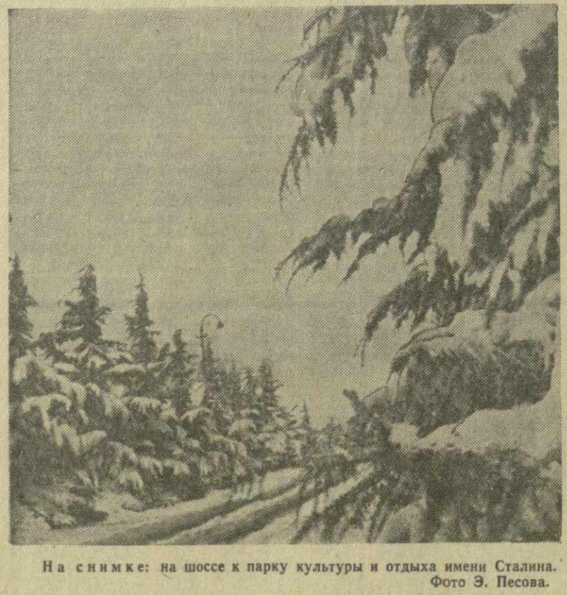
На снимке: на шоссе к парку культуры и отдыха имени Сталина.