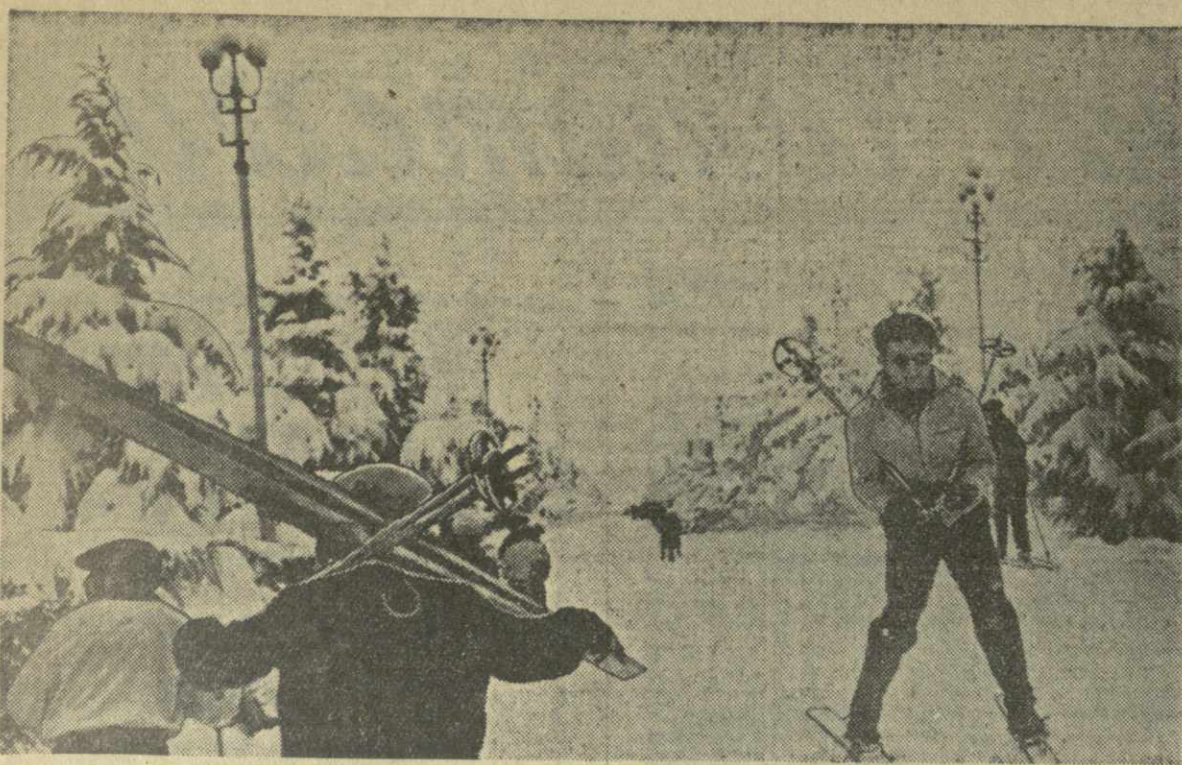
На снимке: в воскресный день в парке культуры и отдыха имени Сталина.