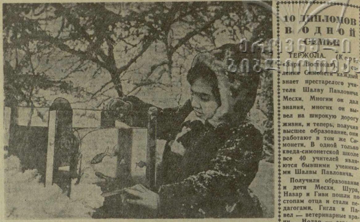
Мороз и солнце. День чудесный...

АДРС РЕДАКЦИИ: Тбилиси, пр. Руставели, 42. ТЕЛЕФОНЫ: заместители редактора — 3-18-04, 3-18-07, ответственный секретарь — 3-17-08, приемная — 3-11-24; ОТДЕЛЫ: партийной жизни — 3-14-82, пропаганды марксистско-ленинской теории — 3-11-22, литературы и искусства — 3-63-28, науки, вузов и школ — 3-30-61, промышленности, транспорта и товарнооборота — 3-22-82, сельского хозяйства — 3-19-49, республиканской информации — 3-17-03, писем и массовой работы — 3-17-44, 3-12-83, иностранных — 3-11-23, иллюстрации — 3-16-27, кабинет рассылки — 3-16-27. Прием объявлений — 3-18-02. ИЗДАТЕЛЬСТВО (ул. Ленина, 14): директор — 3-65-61, заместители директора — 3-22-63. Бухгалтерия — 3-51-81. Директор типографии — 3-24-80. Техническая часть — 3-11-28.