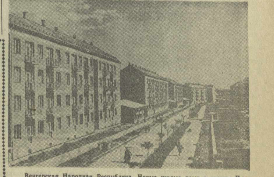
Венгерская Народная Республика. Новые жилые дома в городе Печ.

РАСКРЫВАЮТСЯ КЛАДОВЫЕ «ЧЕРНОГО ЗОЛОТА» ШИРЯТСЯ СВЯЗИ СО СТРАНАМИ ВОСТОКА Дружба Использование нефти в Китае началось, согласно имеющимся историческим данным, более 1,800 лет назад. Однако создание современных предприятий нефтяной промышленности, как указывает журнал «Дружба», началось только в 1907 году. За 42 года, до установления народной власти, в старом Китае была пробурена лишь 71 тысяча метров 123 разведочных и 45 производственных скважин. Максимальная годовая добыча нефти в течение этого периода была достигнута в 1943 году, но она не превышала 320 тысяч тонн. В 1948 году добыча нефти составила всего 90 тысяч тонн. После образования Китайской Народной Республики, пишет журнал, стали раскрываться кладовые «черного золота». Перед нефтяной промышленностью, так же как и перед другими отраслями экономики страны, открылись широкие перспективы развития. С 1949 по 1958 год было пробурено 3,37 миллиона метров скважин. Это в 47,5 раза больше, чем за 42 года в старом Китае. В настоящее время Китай располагает четырьмя крупными нефтяными районами. Это — Циюаньский район в провинции Ганьсу, Джунгарский район в Синьцзян-Уйгурском автономном районе, Цайлапский район в провинции Цинхай и Сычуаньский район. В 1958 году, как сообщает журнал «Дружба», в Китайской Народной Республике было добыто 2 миллиона 260 тысяч тонн сырой нефти.