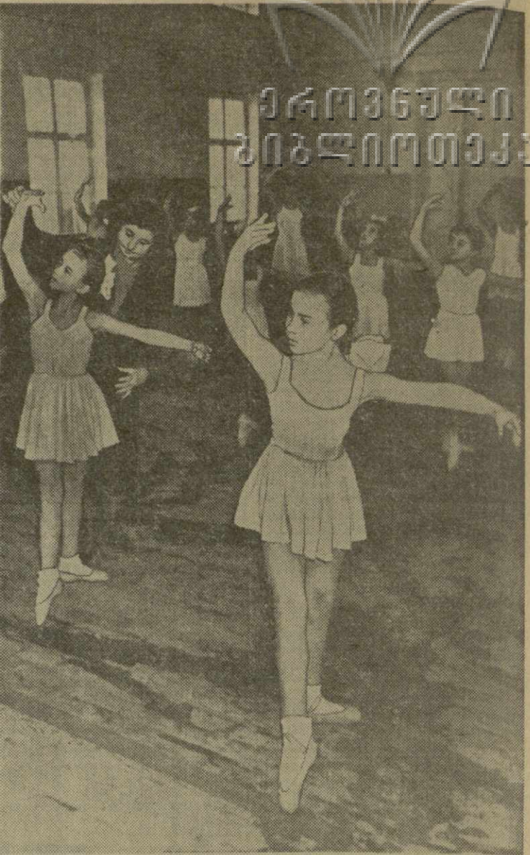
Фото и текст Г. Вахтагандзе.

На снимке: занятия по классическому танцу проводит педагог Т. Выходцова.