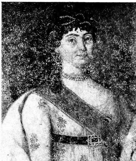
მარიამ დედოფალი, სოლომონ II იმერთა ჰეფას ნეულე

პეტერბურგში მარიამ დედოფლის ცხოვრების შესახებ მის თანამედროვეს, 80 წლის მოხუც გრაფოლ ივანეს ძე დადიანს უამბნია კ. ბოროზდინისათვის. ამ უკანასკნელს ამბავი დედოფლის ცხოვრების შესახებ დაუბეჭდავს ჟურნალ „ნივას“ მე-11 წიგნის დამატებაში. ეს მასალა 1893 წელს „ივერიასაც“ გამოუქვეყნებია.