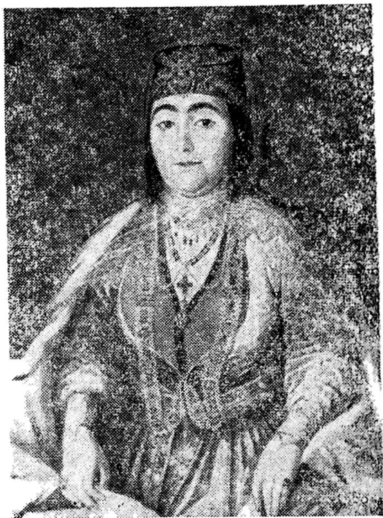
დარეჯან დედოფალი, ერეკლე II-ის მეუღლე (1726—1807)

ერეკლე მეორის მეუღლე დარეჯან დედოფალი პეტერბურგ-