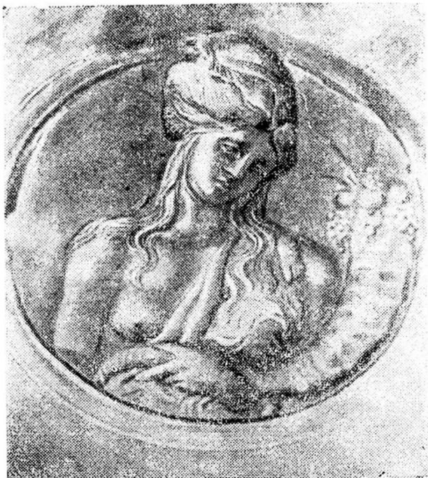
სერაფიტი (ი. ს.)

ზევას ერისთავისა და კარბაკ დედოფლის ასული