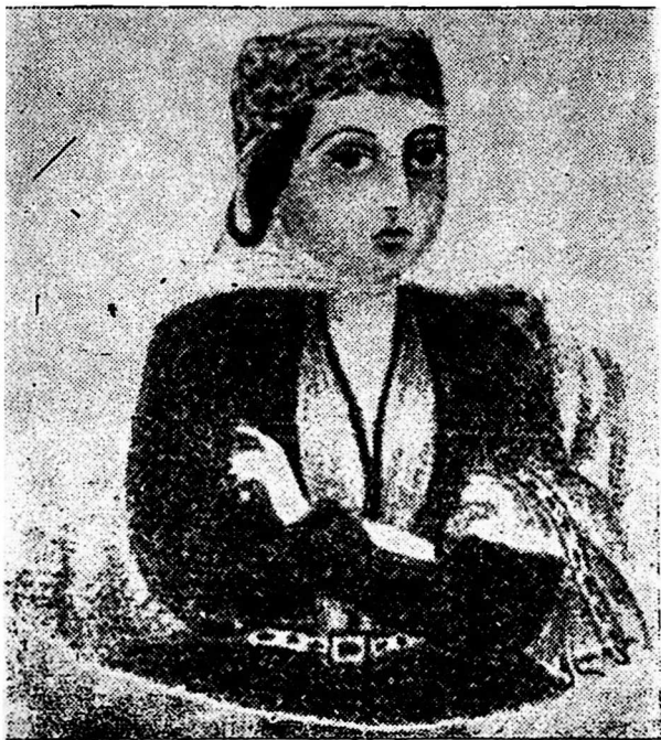
ანა დედოფალი, იმერთა მეფის დაეითის მეუღლე (XVIII ს.)

დიდხანს იყო დაბალული ანა ბატონიშვილი. არ იცოდა, თუ რა ვადით იყო მისი შვილი მუსურის ციხეში დაპატიმრებული. ვერც ის წარმოედგინა, თუ როდემდე უნდა ეცხოვრა ასეთი მდგომარეობაში.