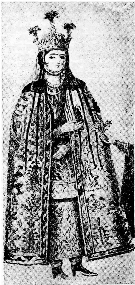
მარიამ დედოფალი (დადიანი), შახნავაზის მეუღლე (XVII ს.)

ელჩები 1633 წლის 23 ოქტომბერს სამეგრელოს გზას დაადგნენ (ქართლის გზები თეიმურაზ პირველს