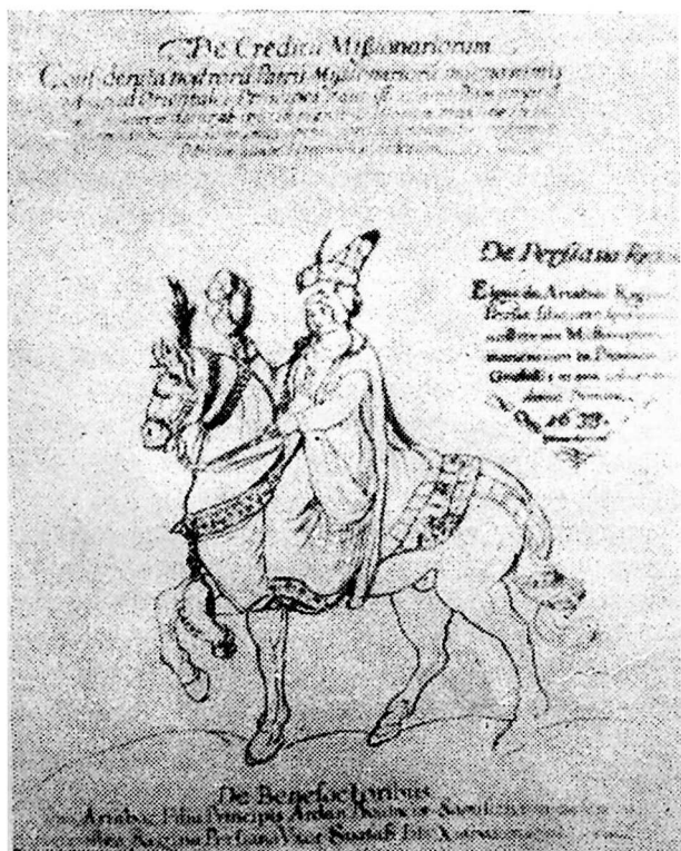
ელენე დედოფალი (ათაბაგი) (XVII ს.)

სამხრეთ-საქართველოს ანუ სამცხე-საათაბაგოს მთიერის (ათაბაგის) როსტომის ქალზე — ელენეზე წერს იტალიელი მწერალი დონ ჯუზეპე ჯუდიჩე მილანელი წიგნში „წერილები საქართველოზე“. ამ წიგნში