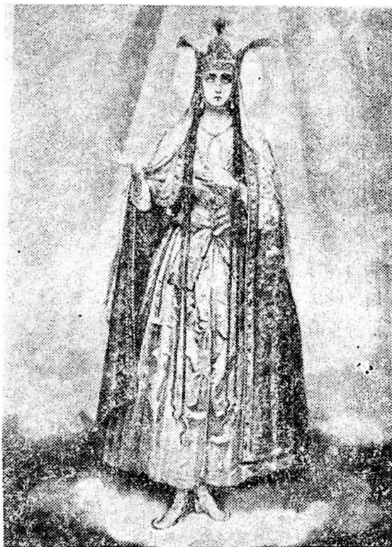
წმინდა მოწამე ქეთევან ღეღოფალი (1575-1624 წ.)

და ღამანა". ამის მიუხედავად, ქეთევანი ქმრის კმაყოფილი არ იყო: ღაეითმა თავისი მამა ალექსანდრე და ძმა გიორგი ციხეში დააპყვედია