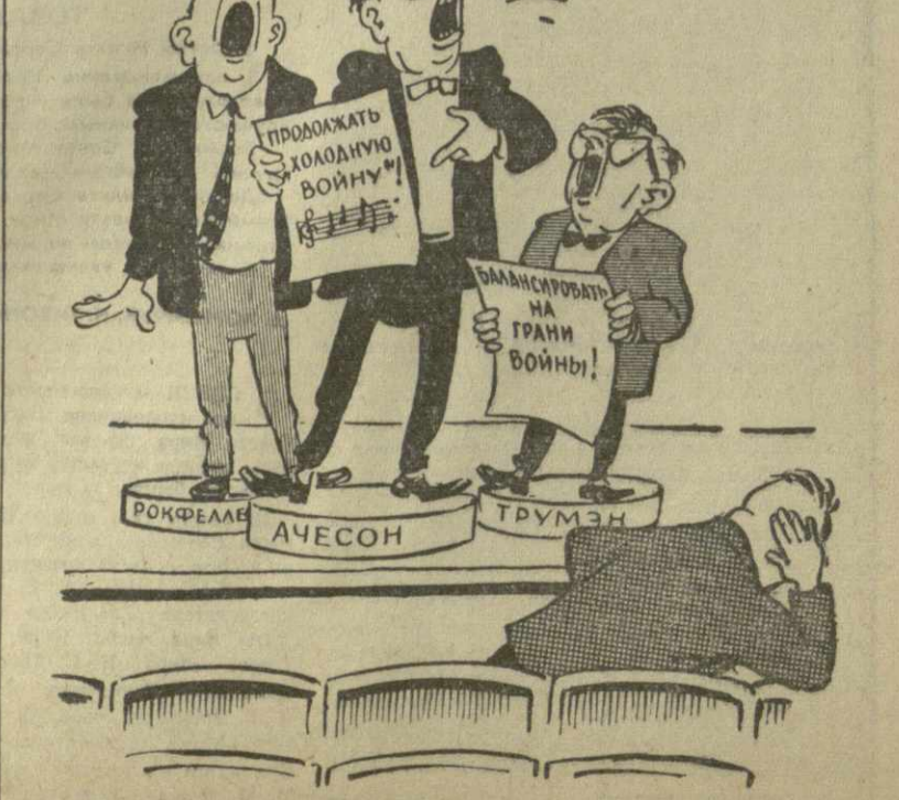
НЕПОПУЛЯРНЫЙ КОНЦЕРТ Рис. А. Кандалаки.

(Из доклада товарища Н. С. Хрущева на сессии Верховного Совета СССР).