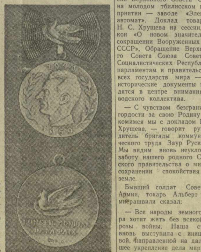
Юбилейная медаль Всемирного Совета Мира, врученная 15 января 1960 года Н. С. Хрущеву. Вверху — лицевая сторона медали, внизу — оборотная сторона медали.